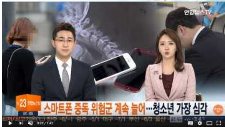
스마트폰 중독 위험군 계속 늘어...청소년 가장 심각 / 연합뉴스TV (1분42초) https://youtu.be/X3VGAODvcyQ