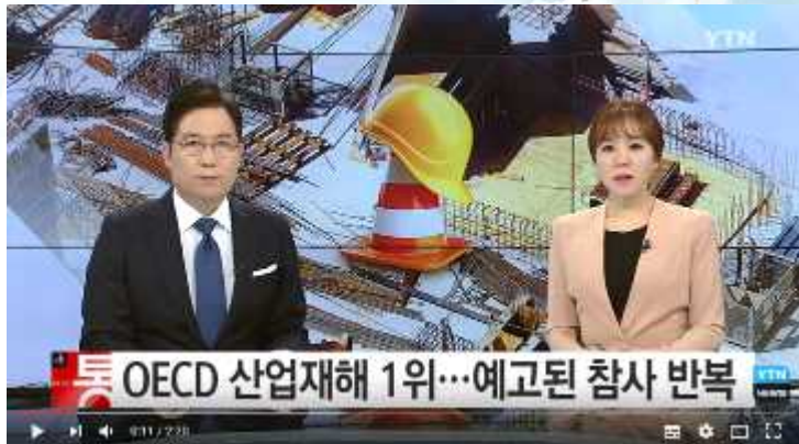
OECD 중 산업재해 1위... '예고된 참사' 반복 / YTN (2분20초) https://youtu.be/C38GJAQdF88